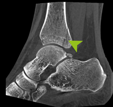
DVT · Sagittaler Schnitt